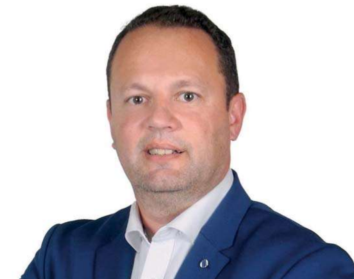
“Outra das preocupações que temos no momento, tem a ver com o aparecimento de roedores”

Não posso esquecer os nossos emigrantes, que mantêm sempre uma ligação muito forte à nossa freguesia, terra que os viu nascer. Tam-